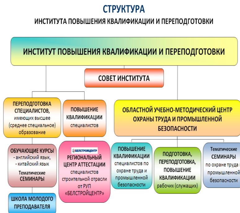
Рисунок 3 - Структура Института повышения квалификации и переподготовки кадров